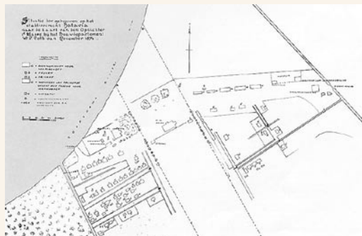
Situatie der gebouwen op het etablissement Batavia naar de kaart van den Opzichter 1e Klasse bij het Bouwdepartement W.L. Loth. November 1874.

Batavia | In het oude Batavia leefden de melaatsen met zijn vieren in eenvoudige huisjes aan het toenmalige hoofdpad van de rivier naar de kerk of aan een van de zijweggetjes. Kerk en latere dokterswoning bouwde men ‘op de loef’ ten opzichte van dit oudste deel. Zowel de huisvesting als de verzorging van de melaatsen liet veel te wensen over. Met de komst van de heer Deutschbein als geneesheer in 1850 verbeterden de medische omstandigheden. Hij overleed echter al in 1851 en J.K. Ooykaas nam het daaropvolgende jaar de positie van medicus over. In een ‘geneeskundig verslag’ geeft hij een opgave over 1 januari 1853. Het onderscheid tussen vrijen en slaven