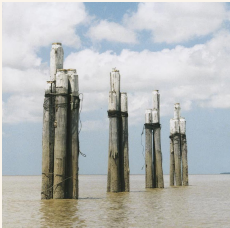
De weidse Coppenerivier | Foto: Michel Bakker