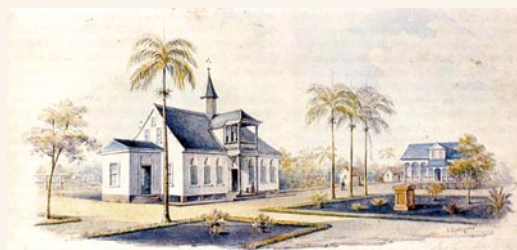
De kerk en de dokterswoning van Batavia omstreeks 1860. Aquarel door L. Springer jr.